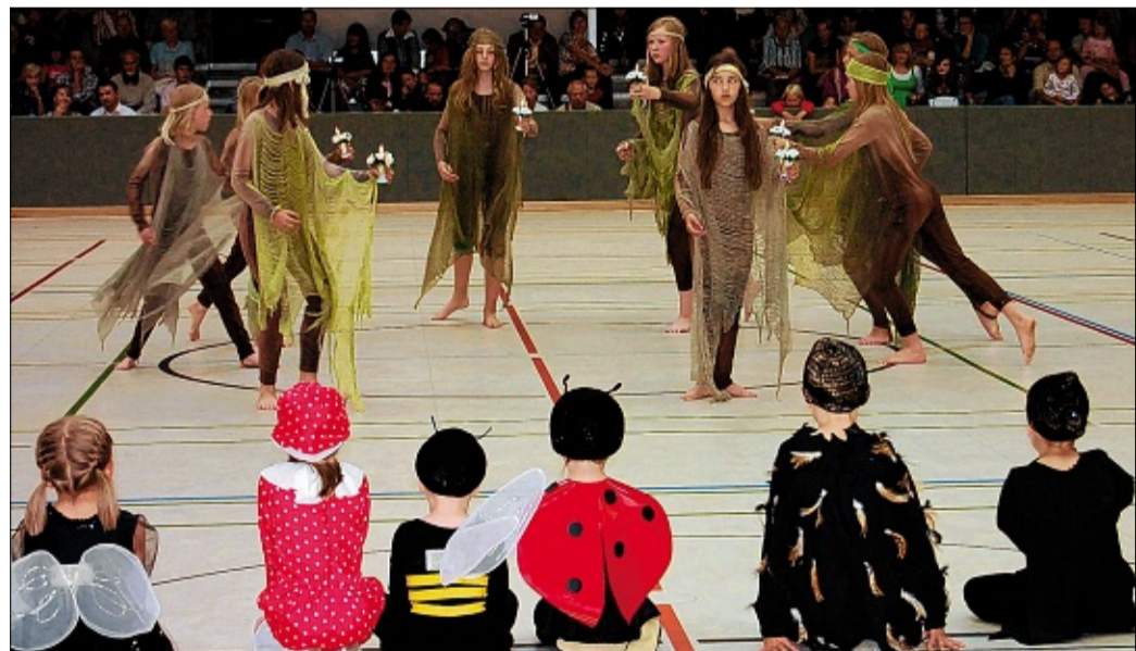
Ausgefallene Tänze und phantasievollen Choreografien: Das „11. Tanzfest“ der Horster Tanzmäuse begeisterte das Publikum und riss es immer wieder zu Applaus hin.

Hohn aus Bad Segeberg mit seinem Triumph TR3A, Baujahr 1959. „Dieses Auto zu fahren, ist das richtige Mittel für Stressabbau“, sagte er. „Das fahre ich lieber, als zu fliegen.“ Und die vorbei kommenden Passanten nutzten es gerne für einen spontanen Schnappschuss. In der Aula der Jakob-Struve-Schule gestalteten unterdessen der Horster Frauenchor und die Horster Liedertafel das Programm unter viel Applaus musikalisch, die VHS Laienspielgruppe erntete für ihr Stück „Swiegermutter to besöök“ ebenso großen Beifall. Auch die historischen Kutschfahrten unter fachlicher Begleitung von Mitgliedern des Ortsarchivs wurden zahlreich angenommen. Im Sportzentrum der Jakob-Struve-Schule fand das „11. Tanzfest“ der Horster Tanzmäuse statt, mit ausgefallenen Tänzen und phantasievollen Choreografien. 60 Kinder und Jugendliche im Alter zwischen vier und 19 Jahren sowie 20 Erwachsene zeigten unter der Lei-