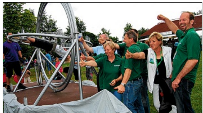
Die Organisatoren freuten sich vor allem über die gelungenen Aktivitäten für die Kinder.